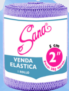
Venda Elástica 2"