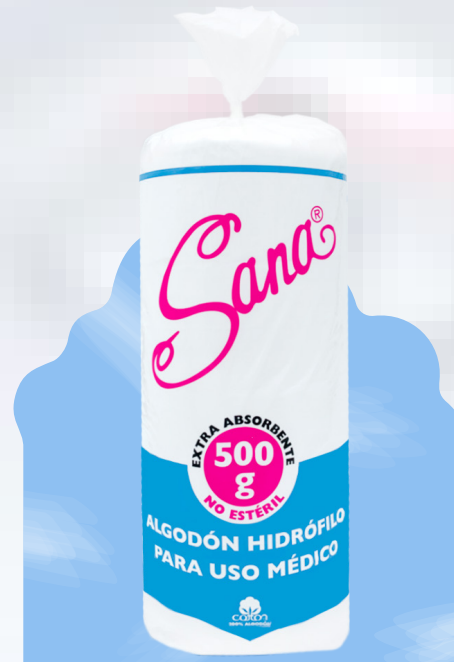
Rollo Algodón Seccionado 500 g.