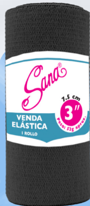
Venda Elástica 3"