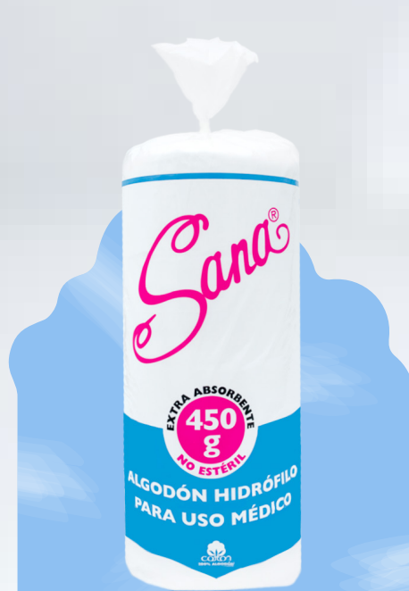
Rollo Algodón Seccionado 450 g.