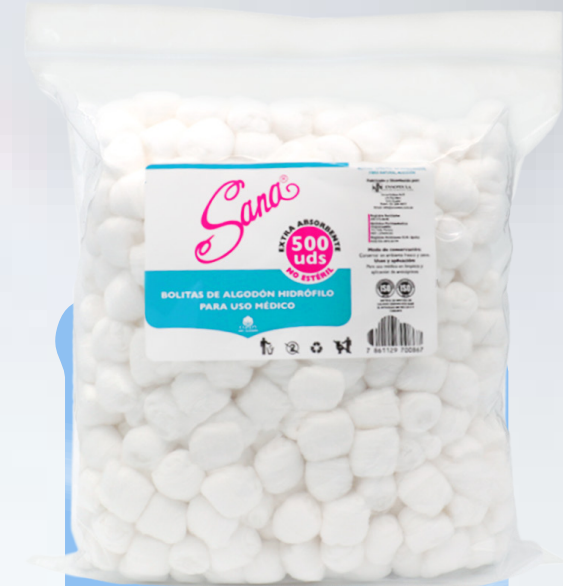
Bolitas de Algodón 500 uds.