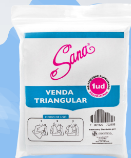
Venda Triangular Iud