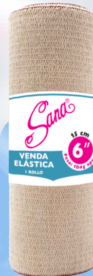
Venda Elástica 6"